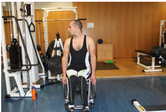
Übung 5 (Oberkörperdrehen und auf jeder Seite ein paar Sekunden in Dehnung)